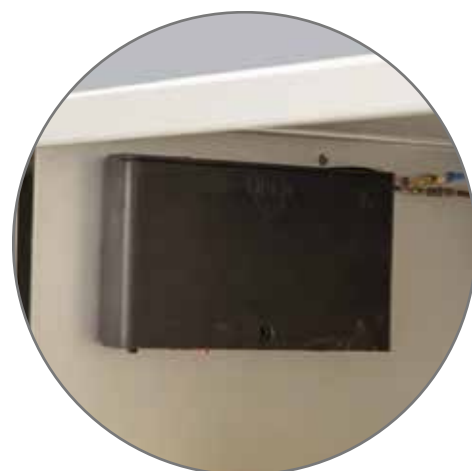
Pilt 11. Moodulköögi sisene patareipesa