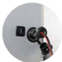
Pilt 12. Juhtmeühendus haagise ja köögi vahel