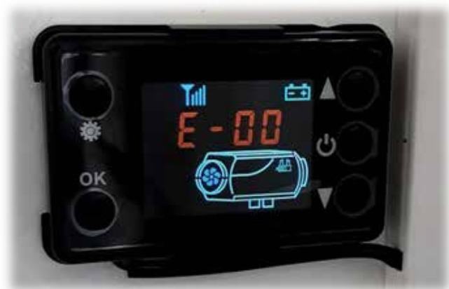
Pilt 7. Ekraanil kuvatav veateade.