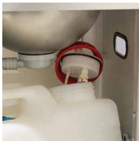
Pilt 15. Puhta vee kanistri kork lahti keeratud