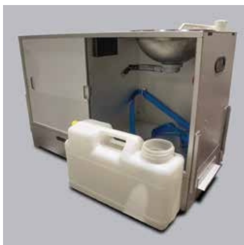
Pilt 16. Puhta vee kanister köögist väljas