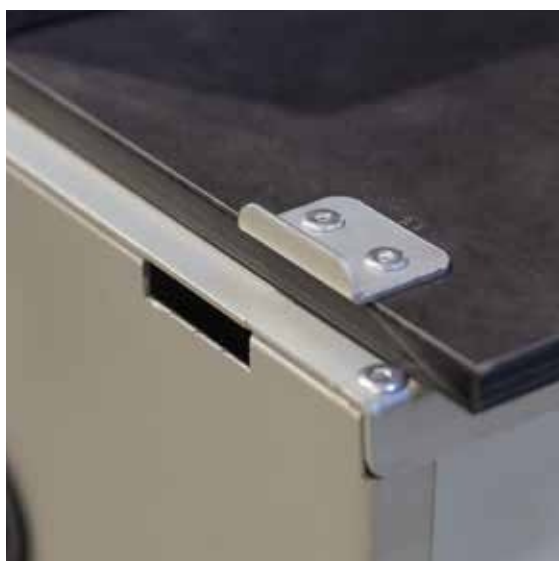
Pilt 19. Köögi külgedel asuvad avad