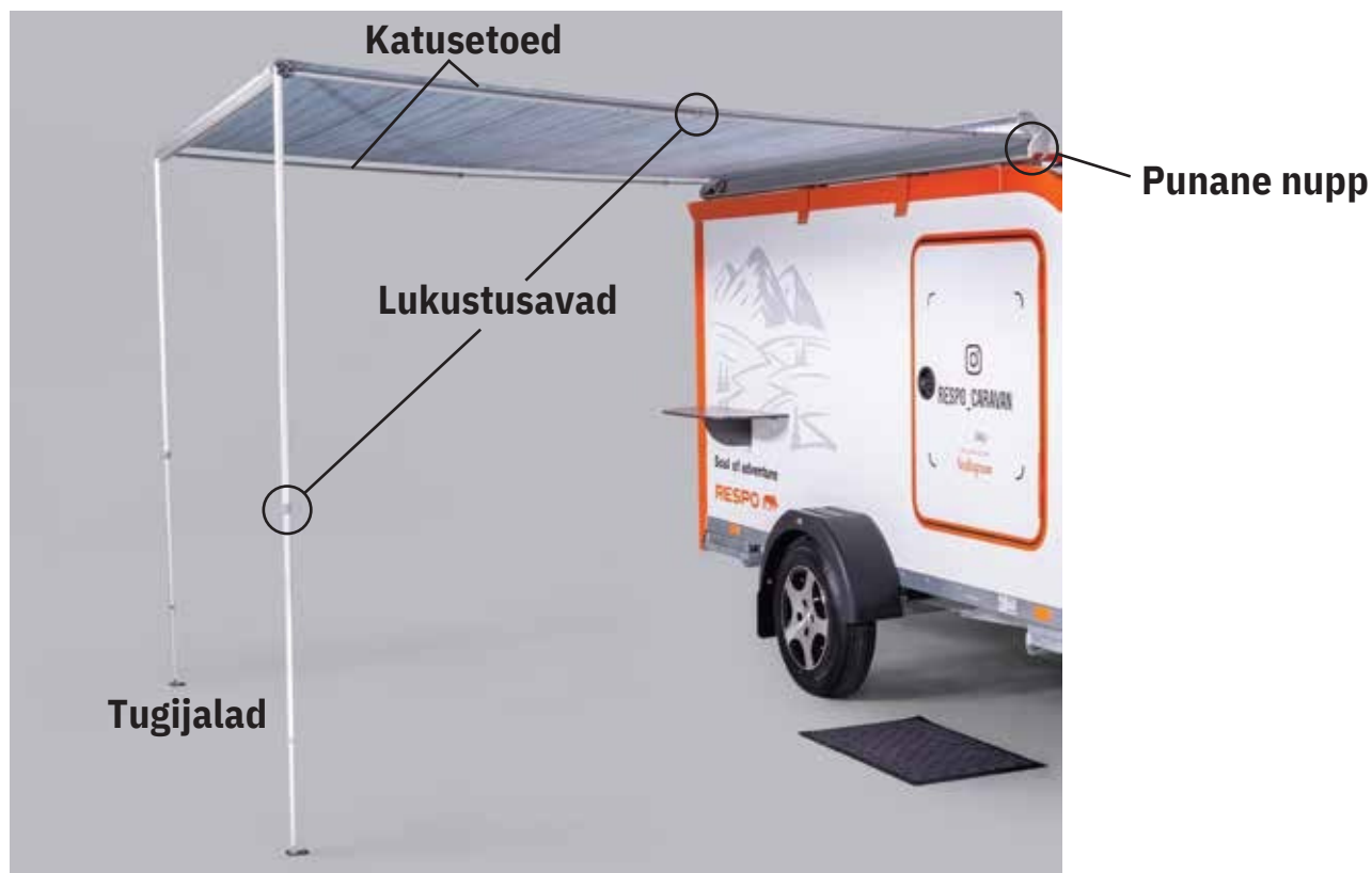
Pilt 9. Avatud markiis

Markiisi kokkupanekuks ühendage lahti toed, asetage need markiisi toru sisse tagasi ja rullige markiis hoidikusse tagasi.