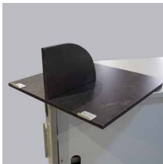
Pilt 18. Külglaua tugi lahtises asendis