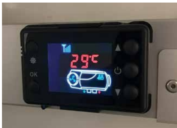
6.2 Ekraan töörežiimis.