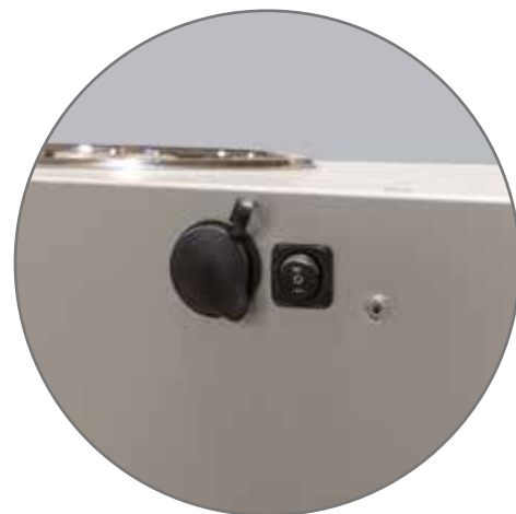
Pilt 10. Lüliti ja pistik tagumisel küljel