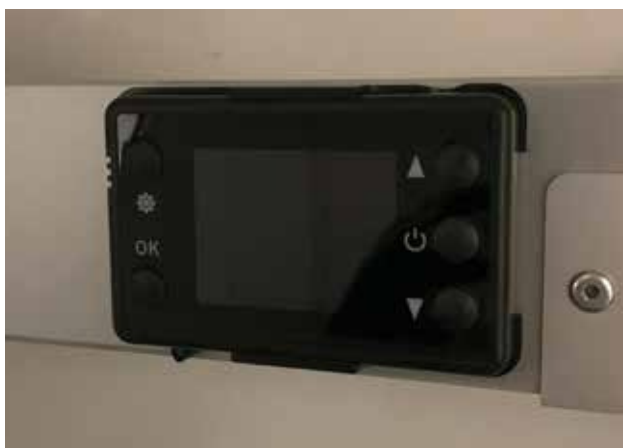
6. Ekraan tavarežiimis.