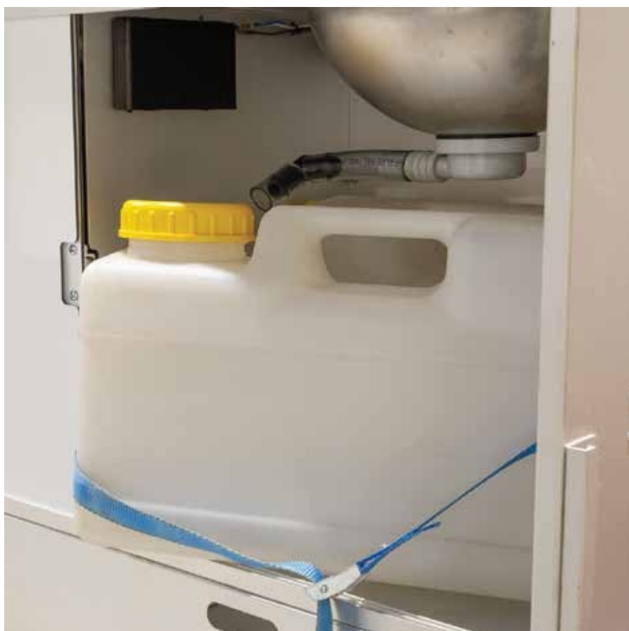
Pilt 13. Reovee kanistri tühjendamine