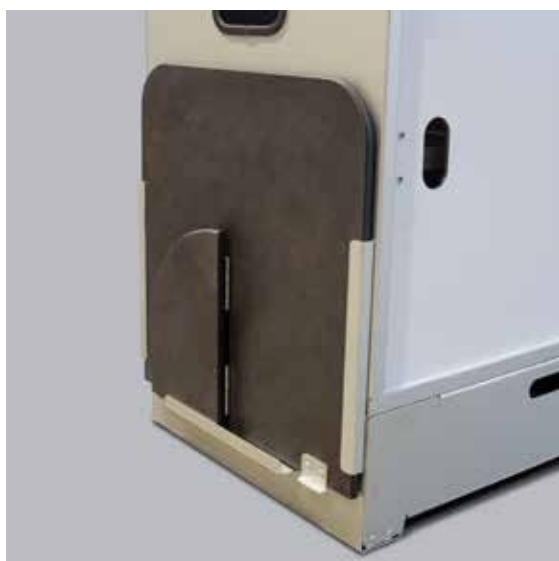
Pilt 17. Külglaud taskus