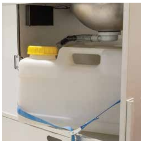
Pilt 14. Äravoolu kanister lahti ühendatud