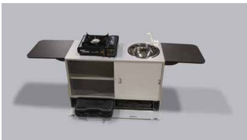
Moodulköök segisti, valamut, gaasipliitide ja külglaudadega.

1. Moodulköögis sisesest patareipesast - Moodulköögi sees on patareipesa ( Pilt 11 ), kuhu mahub 8 AA patareid. Jälgida, et patareipesa lüliti oleks ON asendis ja lüliti I astmes. Patareidega saab pumbata ca. 17 paagitäit (ligikaudu 170 l) vett enne kui patareid täiesti tühjaks saavad.