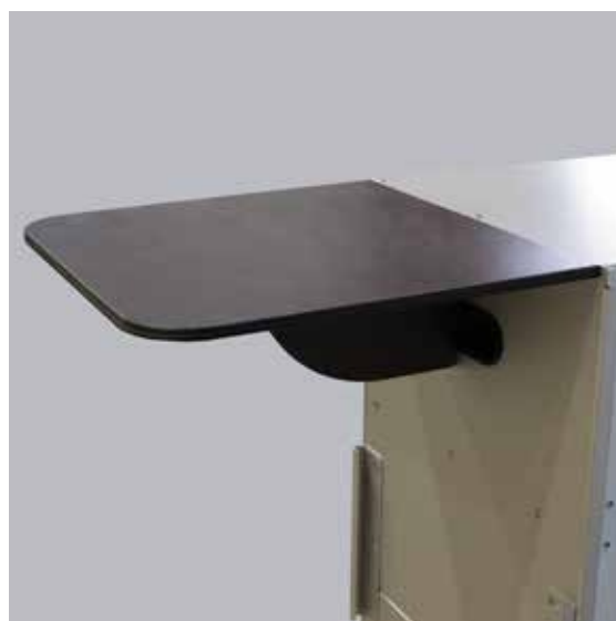
Pilt 20. Külglaud kinnitatuna köögi külge