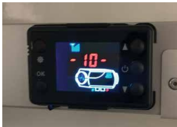
6.4. Võimsuse režiim.